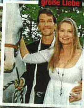
Oben: Hochzeit 1975 Unten: 2008 erneuerten die beiden ihr Gelübde