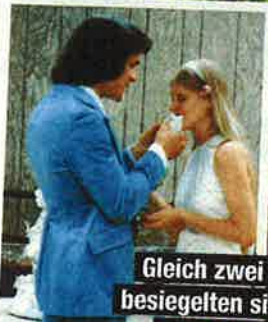
Gleich zwei Mal besiegelten sie ihre große Liebe